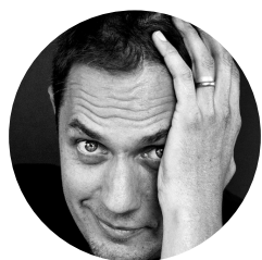
Grand Corps Malade

Aujourd'hui j'ai choisi de vous faire découvrir ou redécouvrir une chanson extraite du dernier album de Grand Corps Malade : Pas essentiel (l'album est au même nom). Grand Corps Malade fait du slam (poésie