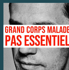
extrait de l'album Pas Essentiel

J'veis sortir de chez moi et marcher dehors, M'arrêter un instant, regarder l'ciel Le soleil, sur les toits, posera ses reflets d'or J'veis kiffer voir ça, vu qu'c'est pas essentiel J'veis m'asseoir sur un banc, cinq minutes avec moi Regarder les gens, renaître au pluriel J'veis parler en silence et sourire à haute voix J'peux faire ça longtemps, vu qu'c'est pas essentiel J'aurais envie d'une B.O. sur mon film du jour Alors j'veis mettre du son dans mes deux oreilles J'ai les poches pleines de mains et les yeux pleins d'amour C'est un moment important, vu qu'c'est pas essentiel Pas essentiel x3 Embrasser quelqu'un, pas essentiel Ouvrir un bouquin, pas essentiel Sourire sincère, pas essentiel Aller aux concerts, pas essentiel Se prom'ner en forêt, pas essentiel Danser en soirée, pas essentiel Retrouver les gens, pas essentiel Spectacle vivant Pas essentiel x3..."